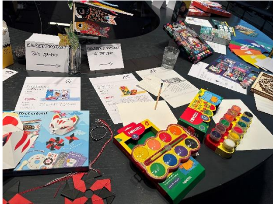
Einblick in die Juryarbeit zum Creative Impulse Award 2026: Die eingereichten Produkte werden direkt am Material, in der Anwendung und im Vergleich der Kategorien geprüft.