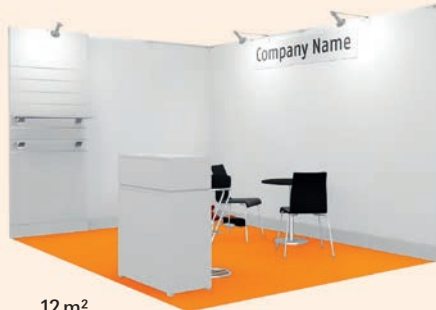
12 m 2