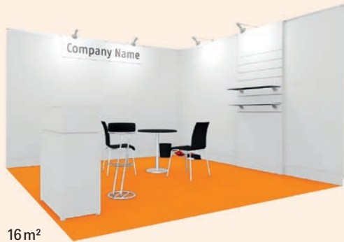
16 m 2