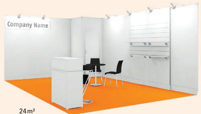
24 m 2